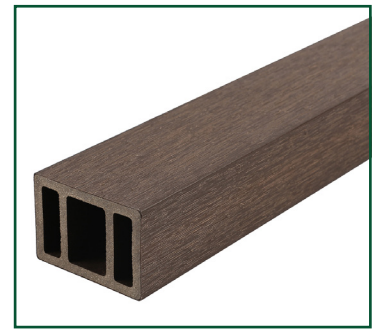
Tabla compuesta de 95% de materiales reciclados de polietileno de alta densidad y fibras de madera.