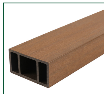
Tabla compuesta de 95% de materiales reciclados de polietileno de alta densidad y fibras de madera.