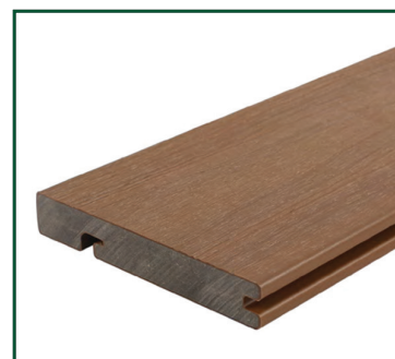
Tabla compuesta de 95% de materiales reciclados de polietileno de alta densidad y fibras de madera.