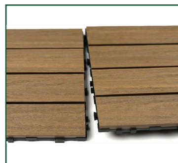
Tabla compuesta de 95% de materiales reciclados de polietileno de alta densidad y fibras de madera.